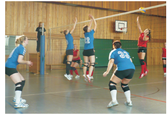
Damenteam im Pokalwettbewerb