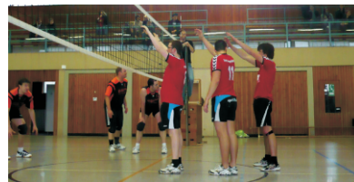
Herrenteam im Punktspielbetrieb

Menschen, die dem Volleyballsport positiv gegenüber stehen und ihn unterstützen