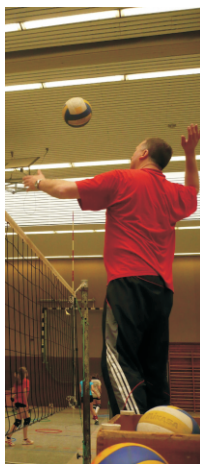
Team-Couch während des Trainings

und unser Konzept, dann gibt es sicher auch ganz individuelle Lösungen für Ihre Unterstützung.